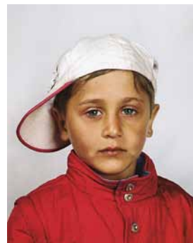
Ei henkilöpapereita, 4 vuotta, Italia