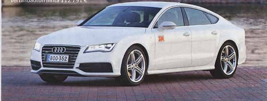
Audi A7 Sportback 3,0 TDI (180 kW) Quattro S tronic

Perushinta 79 998 € Vertailuauton hinta 112 791 €