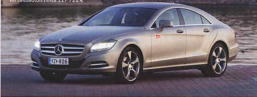
Mercedes-Benz CLS 350 CDI

Perushinta 83 529 € Vertailuauton hinta 117 721 €