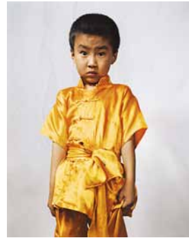
Hang, 5 vuotta, Kiina